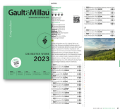
Foto im Weinguide 2023

(nur buchbar bis zum Redaktionsschluss: 25.09.2022 )